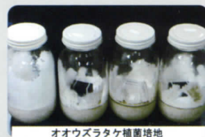
オオウズラタケ培養培地

エコボロン®PRO は京都大学、東京農業大学、(財)建築研究協会などで防腐性能が確認されています。