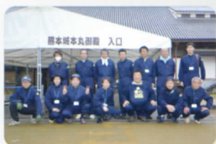
熊本城施工スタッフ

エコボロン®PRO は専門知識を持った認定施工店が、高品質な施工を実施いたします。